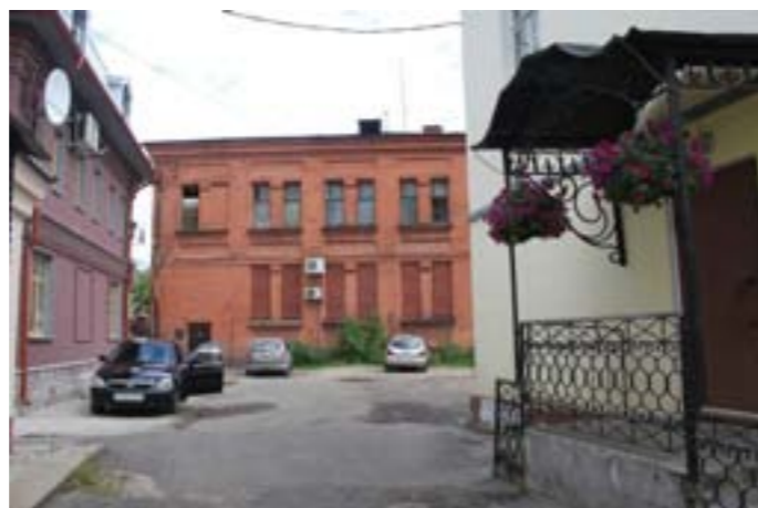
Улица Трефолева с висящими цветами на крылечках выглядит радостнее:

Вот, казалось бы, обычная подворотня на площади Волкова. А повесили цветочки - и совсем другой колорит: