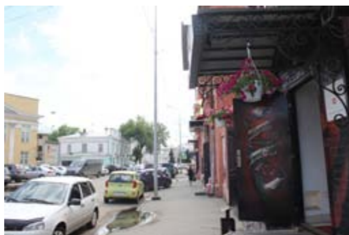
Чем та же улица с крылечками без цветочков.